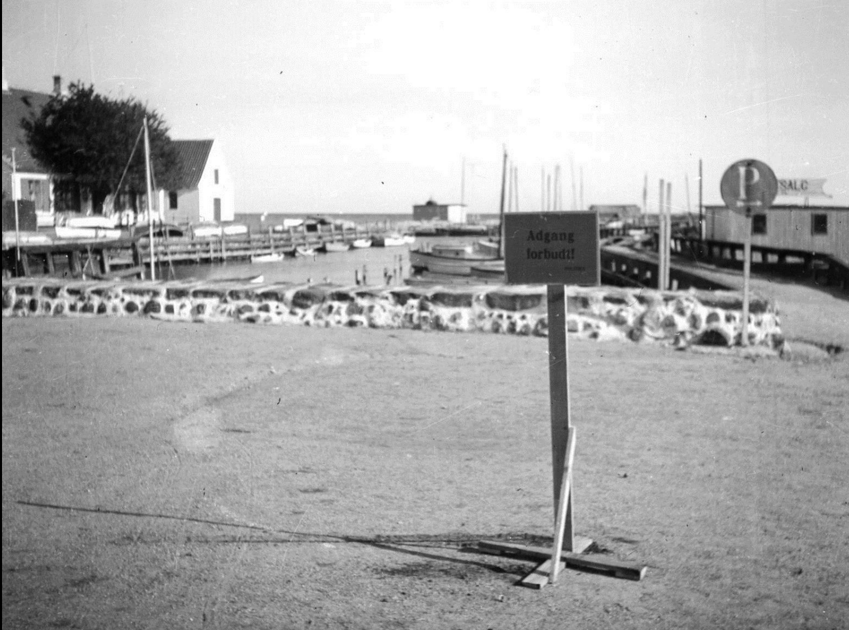
Efter aktionen i Dragør, 4. oktober 1943 blev havnen afspærret