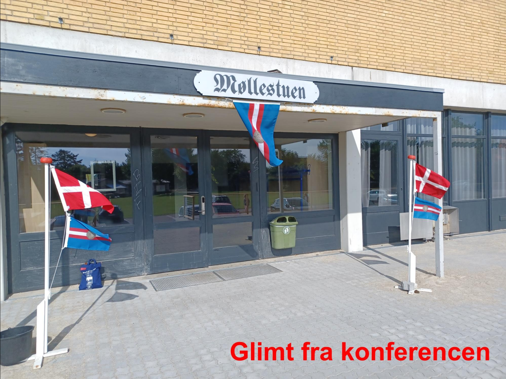
Glimt fra konferencen