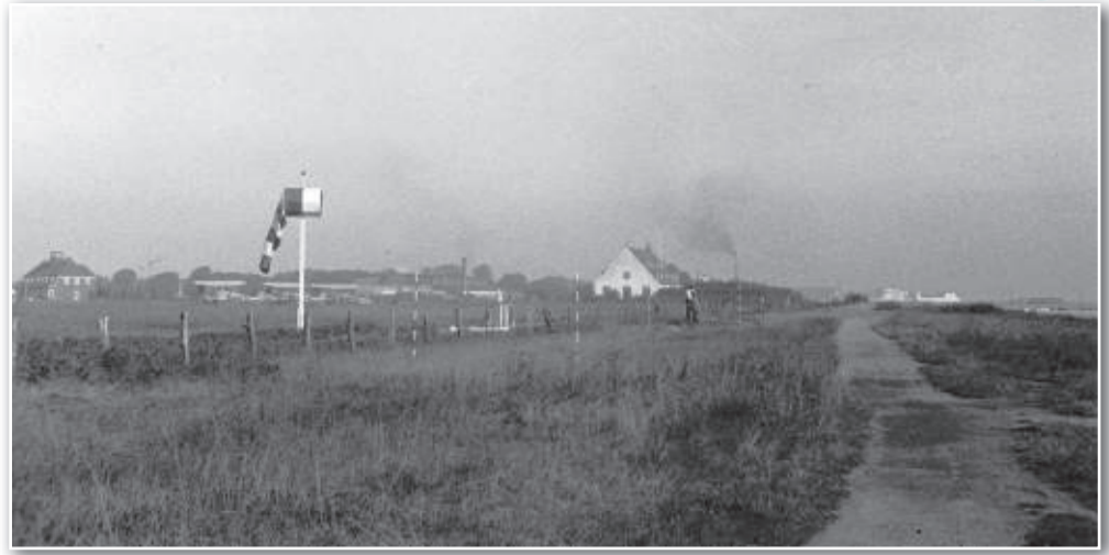
Erik Johansen fotograferede 6. august 1935 den gl. administrationsbygning, Krudthus IV (Hammers restaurant). I baggrunden anes brændstofbeholdere på Kastrup Havn.