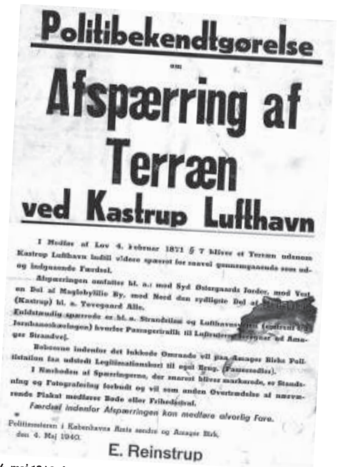
4. maj 1940. Amager Birks politimester meddeler, at store områder omkring lufthavnen er afspærret eller bliver afspærret.