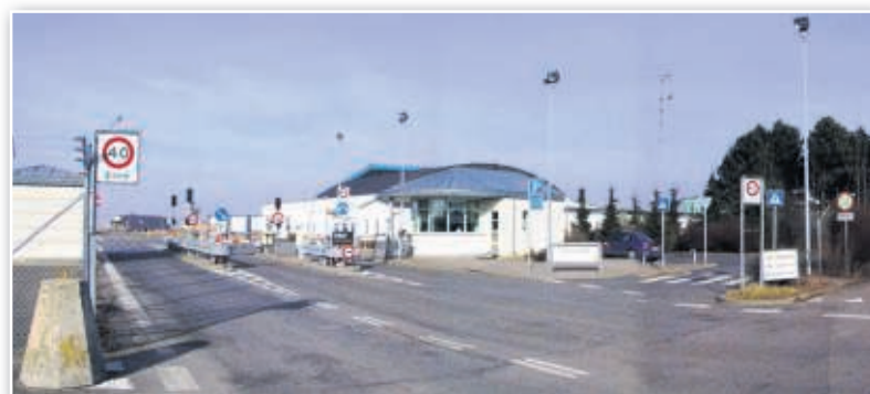
16. marts 2003. Sydvagten. Krydset ved A.P. Møllers Allé (før 2002 hed vejen Ringbakkevej) og Ryvej et halvt år før man begyndte at anlægge den nye civile Kystvej.