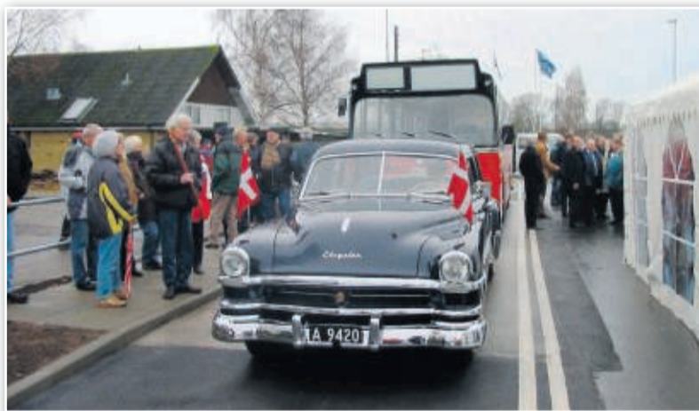
20. november 2003. De indbudte gæster er klar til at køre i kortege fra Sydvagten af den nyåbnede Kystvej. Forrest lufthavns nyrhvervede Chrysler Windsor årgang 1952, der har tilhørt dronning Alexandrine og senere bl.a. hendes yngste søn arveprins Knud.